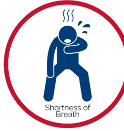
အသက်ရှူကျပ်ခြင်း