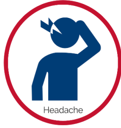
ခေါင်းကိုက်ခြင်း

အထက်ပါရောဂါလက္ခဏာရှိပါက ကျောင်းက သင်၏ appointment ရက်ကို ရက်ပြန်ချိန်းပေးပါ။ သင့်ကလေးကို လာကြိုဖို့ရောက်လာရင် ကျေးဇူးပြုပြီး ဘဲလ်တီးပါ။