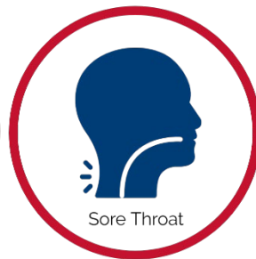
Dolor de Garganta