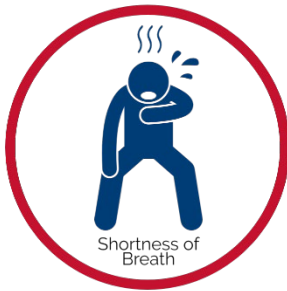
Corto de Respiración