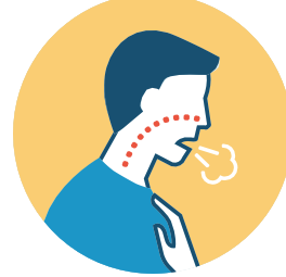
ضيق في التنفس