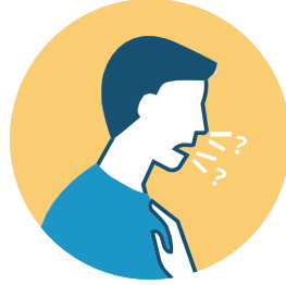
فقدان التذوق أو الرائحة

هل كنت على اتصال وثيق (في غضون 6 أقدام لأكثر من 15 دقيقة) مع أي شخص تم تأكيده هل كنت على اتصال وثيق (في غضون 6 أقدام لأكثر من 15 دقيقة) مع أي شخص لديه COVID-19