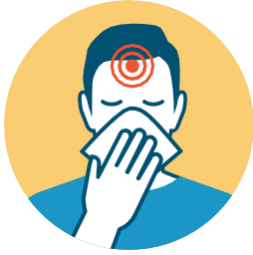
احتقان أو سيلان